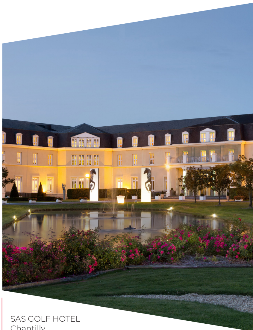
SAS GOLF HOTEL Chantilly

Het Boekhoudkundig Nettoactief per aandeel bedraagt € 4,0 op 30 juni 2019.